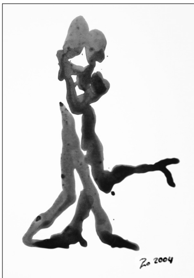
Vorkreuz - Voleo!

Kleinen Stammesgruppen von den Jägern und Sammlern entsprechen frühe Tänzer des heroischen Zeitalters, denen jede Abstraktion fehlt, die nur durch Nachahmung und Wiederholung lernen. Die Kommunikation ist beschränkt durch die Zahl der "Wissenden" und die Art der Verbreitung. Es herrscht geringe Inno-