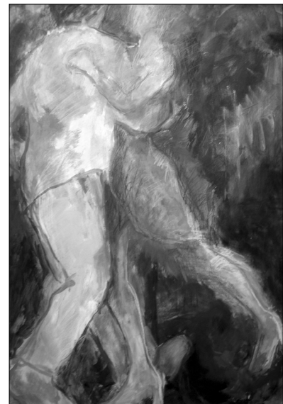
Ohne Eile (P.L.-O.)

Das einzige Hindernis auf diesem Weg der Verbreitung könnte Mauricio selbst sein, wenn er der Versuchung erliegen sollte, seiner Idee auf ausschließlich kommerziellem Weg zum Durchbruch zu verhelfen.